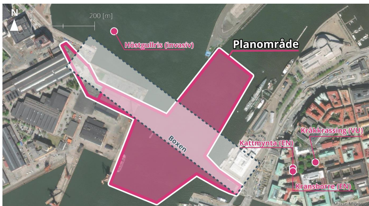
Figur 4. Detaljkarta över tidigare artnoteringar i närområdet till boxen från Artportalen.se. Höstgullris är en landlevande växt och har troligen rapporterats in av allmänheten med mindre noggrannhet, därav har den hamnat i ett vattenområde på kartbilden. Troligen är den verkliga positionen för arten mer kopplat till Hugo Hammars kaj.