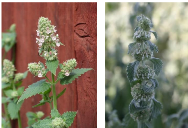
Figur 2. Bild föreställande Kattmynta (vänster) och Kransborre (höger).

Vid platsbesöket som genomfördes 2023-03-16 av sakkunnig biolog skannades landytor av för att identifiera eventuella naturvärden som inte framgick av genomförd fjärranalys. Då större delen av boxen utgörs av hårdgjorda ytor, refuger eller ruderatmark (grusig restyta) kunde inga större naturvärden noteras inom boxen. Inga noteringar av invasiva arter inom boxen gjordes under fältbesöket. Däremot identifierades ruderatmarken på Hugo hammars kaj som en potential häckningslokal för fåglar kopplat till Göta älv. Då området över Göta älv även är ett flygstråk för flyttfåglar samt viktig övervintringslokal (vid mynningar av vattendrag och kanaler bland annat Kvillebäcken), har det därför utförts en fördjupad utredning gällande fåglar som presenteras i nedan kapitel.