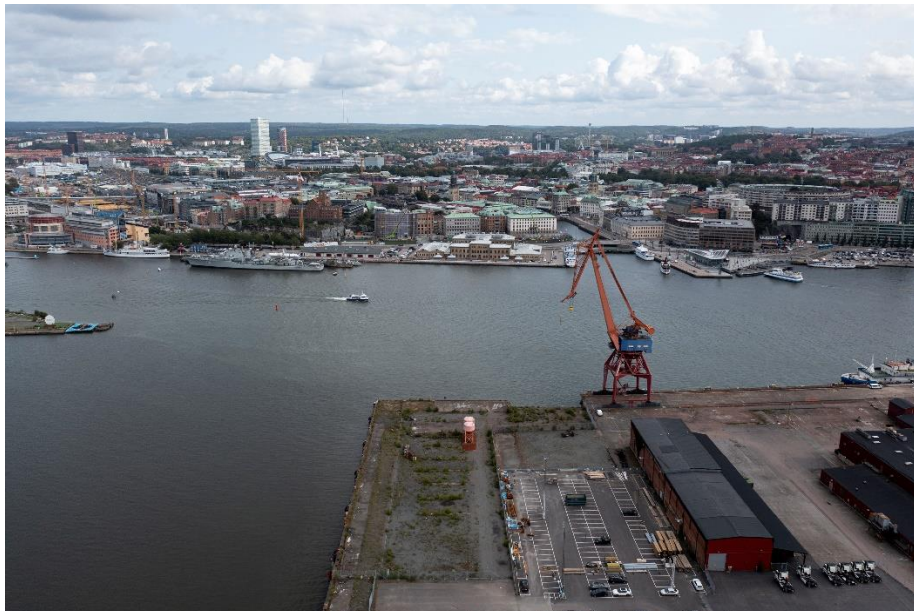
Figur 5. Flygfoto över Hugo Hammars kaj. Ruderatmark syns längst ner i bild, på kajens vänstra sida.

Det aktuella området inom boxen utgör en hårdexploaterad stadsmiljö dominerad av hårdgjorda ytor, men på Hugo Hammars kaj förekommer ruderatmark med grösytor och lövsly, se Figur 5.